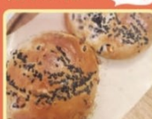
つばさベーカリー

弥生時代に入ると稲作が盛んになり、いろいろな 穀物も作られるようになったことを踏まえ、十勝 の粒あんに黒米、玄米、麦など17穀を混ぜ 込んだあんぱん。クルミたっぷり の生地で包んだプチプチ食感と 香ばしさがあったまらぬ! この他 にも弥生グルメパンを販売中。