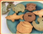
NPO法人のぞみハウス

勾玉やサメ、亀、古銭や弥生人、壺など青谷 上寺地蔵遺跡から出土した遺物を形どった珍しい クッキー。米粉で作られてあり、ふんわり 甘い香りとサクッとした食感が 一度食べたらクセになる! 見た目 もかわいい。素朴で自然な美味 しさをお土産にどうぞ!