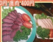
ジビエ工房 弥生の里

太古の昔は重要なタンパク源であった鹿、 猪も現在では肉を売らずに肉介者として、青谷町 だけでも毎年数百頭が駆逐されている。 これらの命をジビエとして、店主の 「より美味しく、より安価に」 をモットーに焼し焼き(燻製) で販売している。