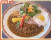
コービー&カレー 五島

弥生人がミソカレーを食べていたのなら…と 想像し、試行錯誤しながら開発したメニュー。 弥生時代に食べられていたと言われる猪肉や クルミを使用し、野菜もたっぷり 入れたことでかき味あえない白濁 のキーマカレーは味はもちろん、 個性的な食感もぜひご賞味あれ!