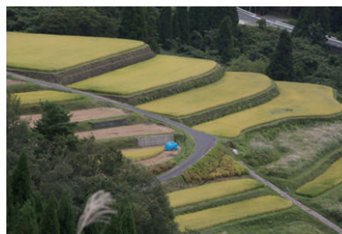
棚田 100 選のつく米棚田