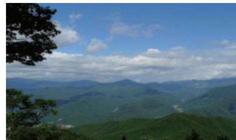
三倉富士からの展望(氷ノ山方面)