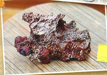
しぜんどう 自然銅