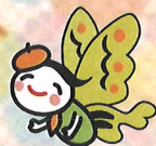
池田家墓所キャラクター 池澤チヨウ