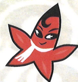
池田家墓所キャラクター ラッキー

宮下地区公民館 鳥取市国府町宮下 1012 TEL: 0857-26-5925 FAX: 0857-26-5929