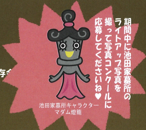
池田家墓所キャラクター マダム燈籠

期間中に池田家墓所の ライトアップ写真を 撮って写真コンクールに 応募してくださいね♡