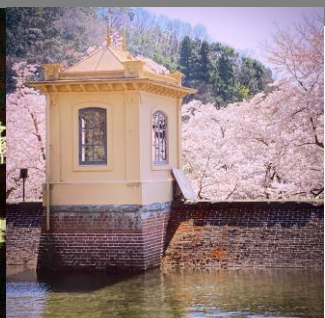
山陰最古の近代水道施設 - 国指定重要文化財旧美歎水源地水道施設 -